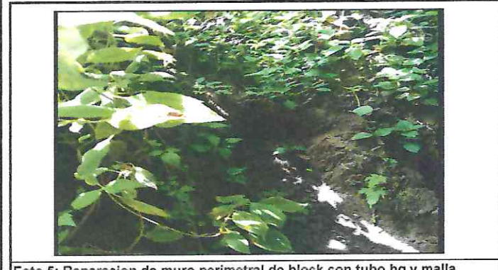
Foto 5: Reparacion de muro perimetral de block con tubo hg y malla galcanizada, soleras intermedias y columnas.