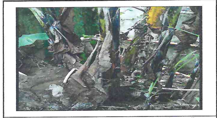
Foto 4: Reparacion de muro perimetral de block con tubo hg y malla galcanizada, soleras intermedias y columnas.