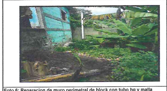
Foto 6: Reparacion de muro perimetral de block con tubo hg y malla galcanizada, soleras intermedias y columnas.

Observación: Si es necesario se pueden agregar hojas adicionales y actualizar el número de hojas.