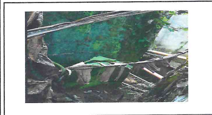
Foto 3: Reparacion de muro perimetral de block con tubo hg y malla galcanizada, soleras intermedias y columnas.